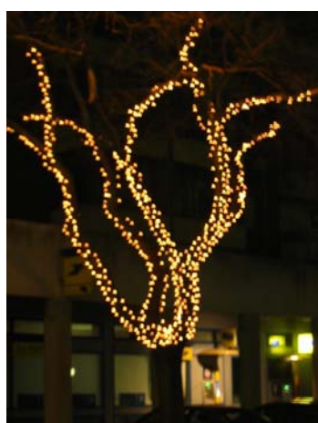
Secteur Place des Pavillons