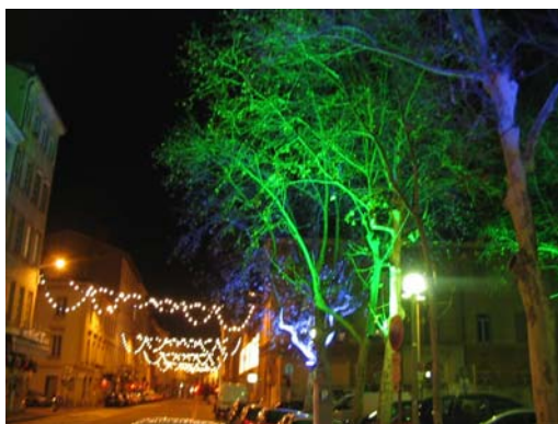
Place Saint Louis, rue de la Madeleine

Il est à noter, qu'au cours de nos visites terrain, les commerçants de la rue de Marseille et de la partie sud de l'avenue Jean Jaurès (secteur Gerland) ont manifesté le désir d'être illuminés en 2007.