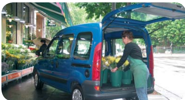
Pour transporter vos marchandises, Autolib' !

* Le nombre de véhicules disponibles augmente régulièrement. Pour plus d'informations, www.autolib.fr